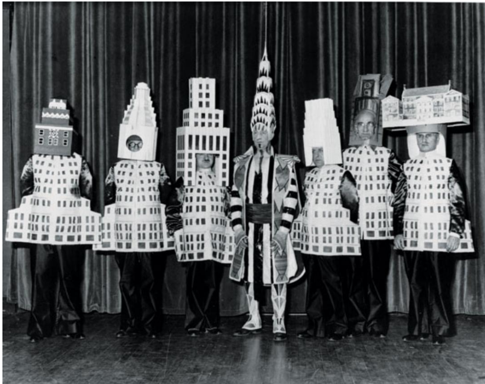
1931 Beaux art ball New York.