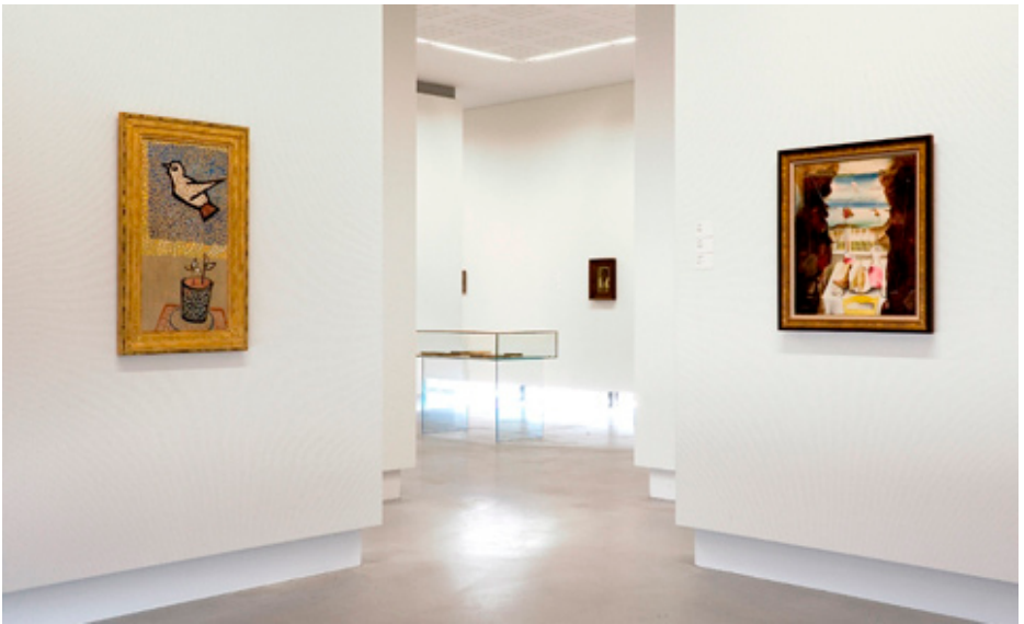
interieur museum belvedere

Tot slot wordt er nog een keukentoren gebouwd. Deze zal in belangrijke mate het nieuwe gezicht zijn van de Nederlandstalige COOVI-Elishout campus. In dit gebouw zijn les- en restaurantkeukens verticaal gestapeld tot een torengebouw van 14 verdiepingen. Dit centrale glazen gedeelte waarbinnen deze functies gestapeld zitten, bestaat uit open kolomloze vloerniveaus van 12x12m. Bovendien wordt de toren gedragen door drie groepen kokers, 2 zijn traphallen en 1 is voor de technieken.