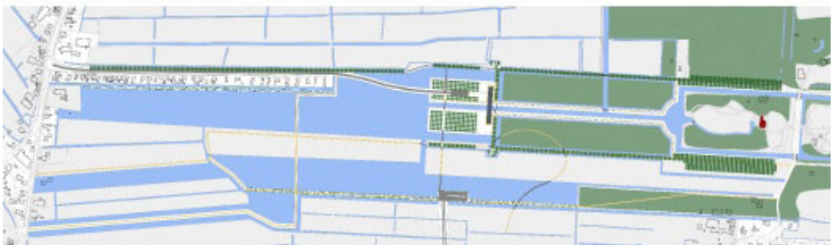
voormalige + nieuwe situatie